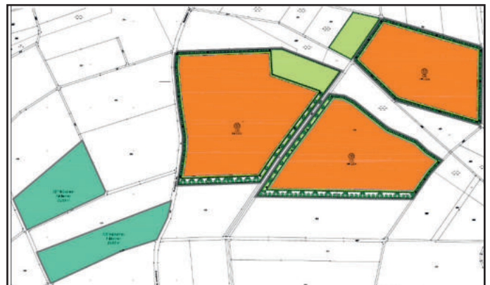
Abb. Geltungsbereich des Vorhabens (ohne Maßstab)

Dieser Bereich soll als Sondergebiet ausgewiesen werden. Die Lage und Abgrenzung ist aus dem nachfolgenden Kartenausschnitt ersichtlich (maßstabslos).