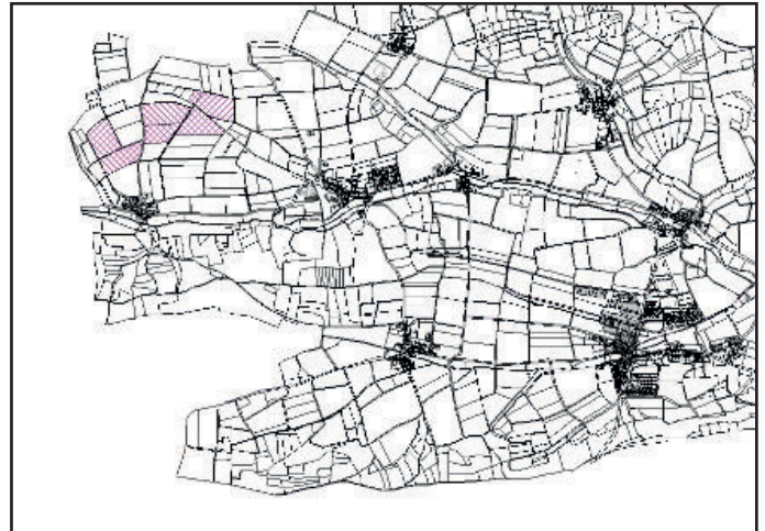
Abb. Übersicht Lage des Vorhabens

Der Geltungsbereich liegt im nord- / westlichen Teil des Marktgebietes von Vestenbergsgreuth über dem Ortsteil von Pretzdorf (Landkreis Erlangen-Höchstadt, Regierungsbezirk Mittelfranken).