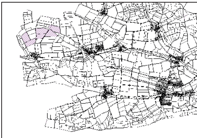
Abb. Übersicht Lage des Vorhabens Die Darstellung entspricht nicht dem Änderungsbereich der 14. Änderung des FNP, sondern nur zur veranschaulichung, wo sich das Vorhaben und die Ausgleichsflächen befindet.

Der Geltungsbereich liegt im nord- / westlichen Teil des Marktgebietes von Vestenbergsgreuth über dem Ortsteil von Pretzdorf (Landkreis Erlangen-Höchstadt, Regierungsbezirk Mittelfranken).