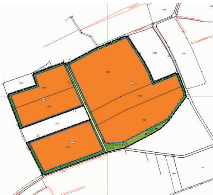
Abb. Bebauungsplan (nicht maßstäblich)

Die externe Ausgleichsfläche umfasst das Flurstück Fl. Nrn. Nr. 2174 in der Gemarkung Mühlhausen (Gesamtfläche 35.155 qm), die sich 1.400 m nordwestlich des o.g. Plangebietes, nördlich der Gemeindeverbindungsstraße nach