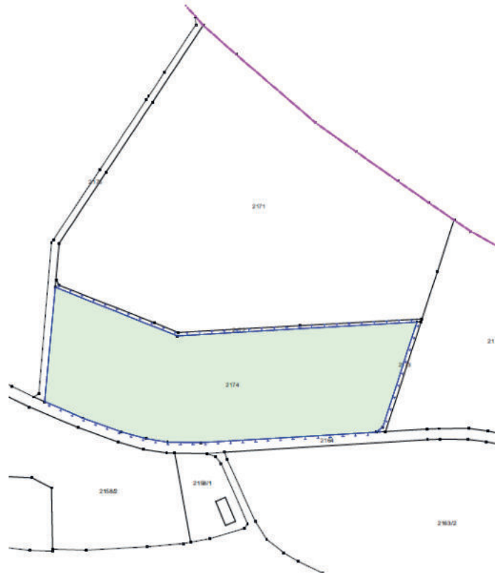
Abb. Ausgleichsfläche (nicht maßstäblich)

Die Lage und Abgrenzung ist aus dem nachfolgenden Kartenausschnitt ersichtlich (maßstabslos).