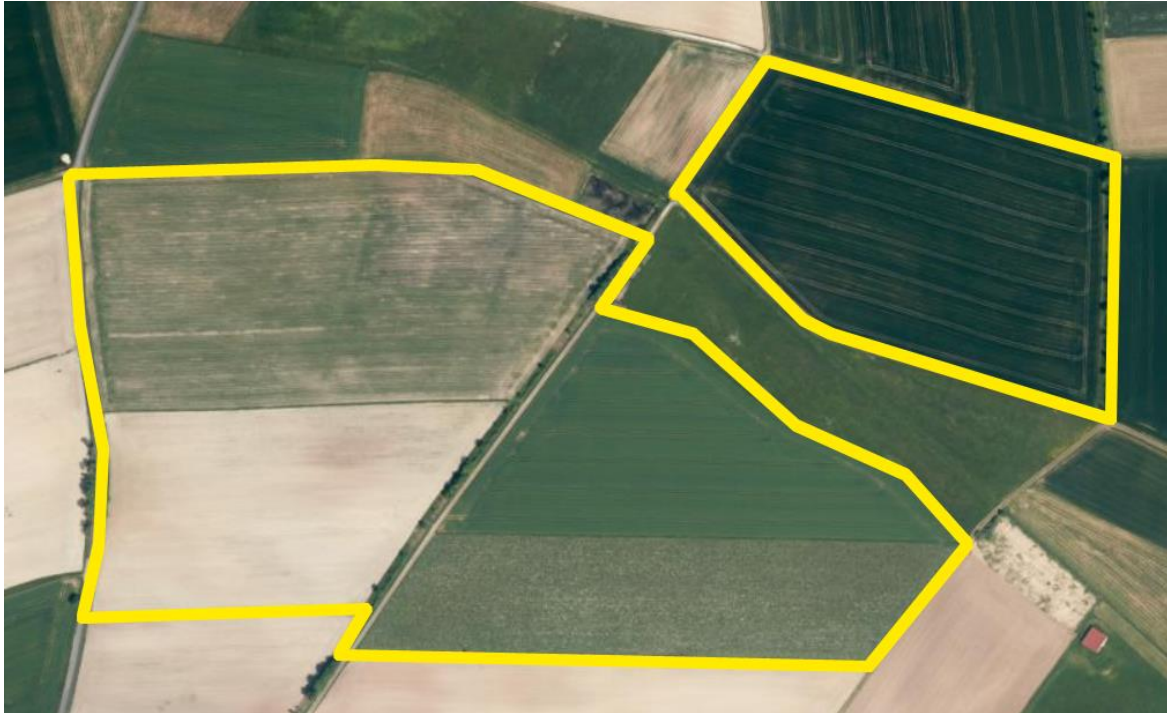
Abb. 3: Lage der geplanten PV-Anlage