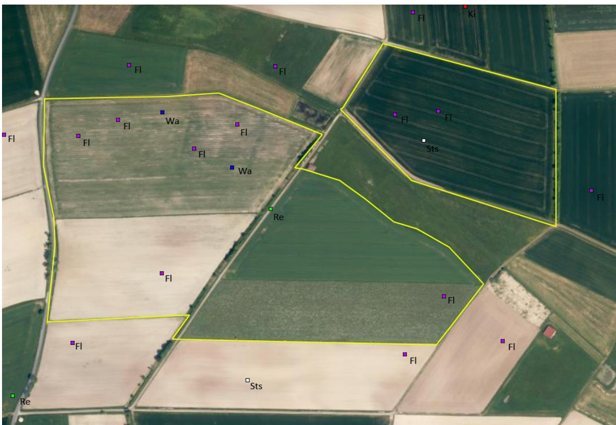
Abb. 5: Erfasste Feldlerchenreviere

Feldlerche (B), Kiebitz (DZ), Rebhuhn (A), Wachtel (A), Rauchschwalbe (NG), Rotmilan (NG), Steinschmätzer (DZ)